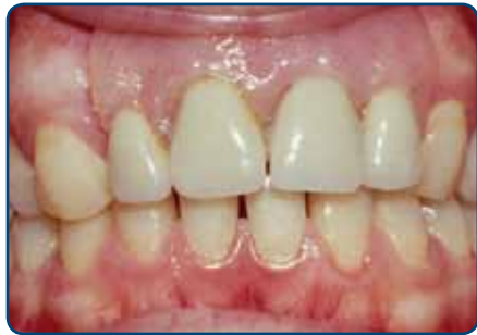
Plaatprothese van voren

De plaatprothese is gemaakt van een roze, tandvleeskleurige kunsthars. Daarin zijn de kunsttanden en -kiezen verankerd. De gehele plaatprothese rust op het slijmvlies van de mond. Deze zit eventueel met ankertjes vast aan overgebleven tanden of kiezen.